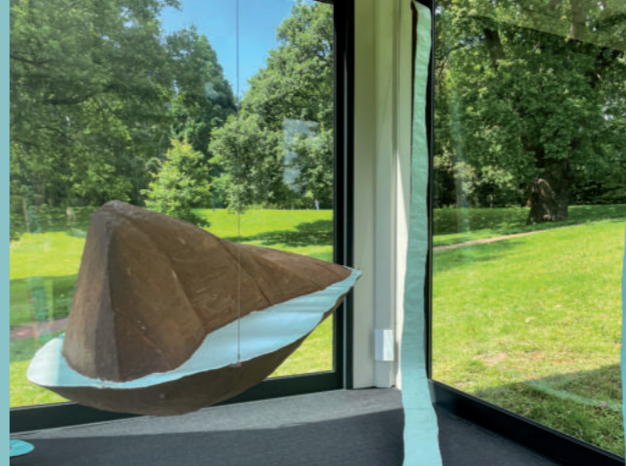
Ausstellungsansicht „Schwebende Wasser“, Willi Weiner, Glaskubus, Kroops Park, Foto: Carsten Heilmann